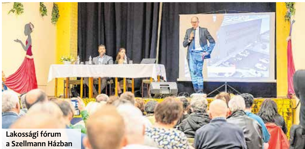
Lakossági fórum a Szellmann Házban

Érd ráadásul már korábban világos szabályokat alkotott: szerződésben, közgyűlési