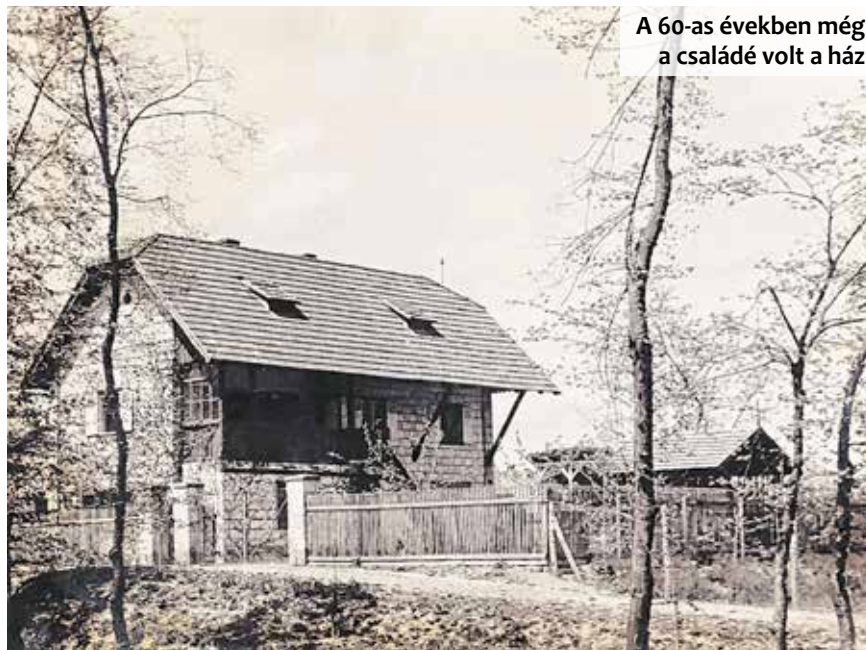
A 60-as években még a családé volt a ház

2021 júliusára pedig elkészült egy koncepcióterv a további fejlesztésekről és továbblépési lehetőségekről. Ebből kiolvasható, hogy