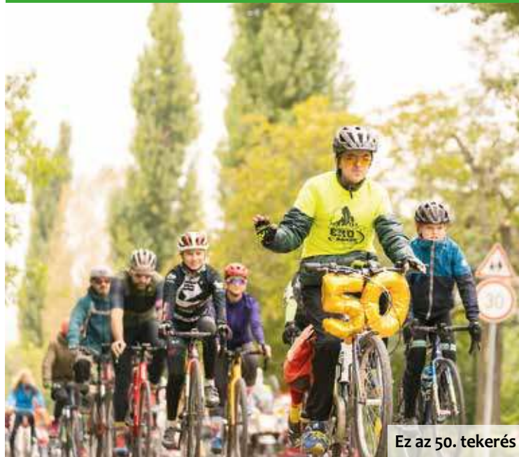
Ez az 50. tekerés

Október 6-án immár ötvenedik alkalommal szelték át a várost az Érd Körbe lelkes biciklistái. Az első kerékpáros felvonulást 2002. szeptember 22-én tartották, ami azóta településünk egyik legnépszerűbb programjává nőtte ki magát.