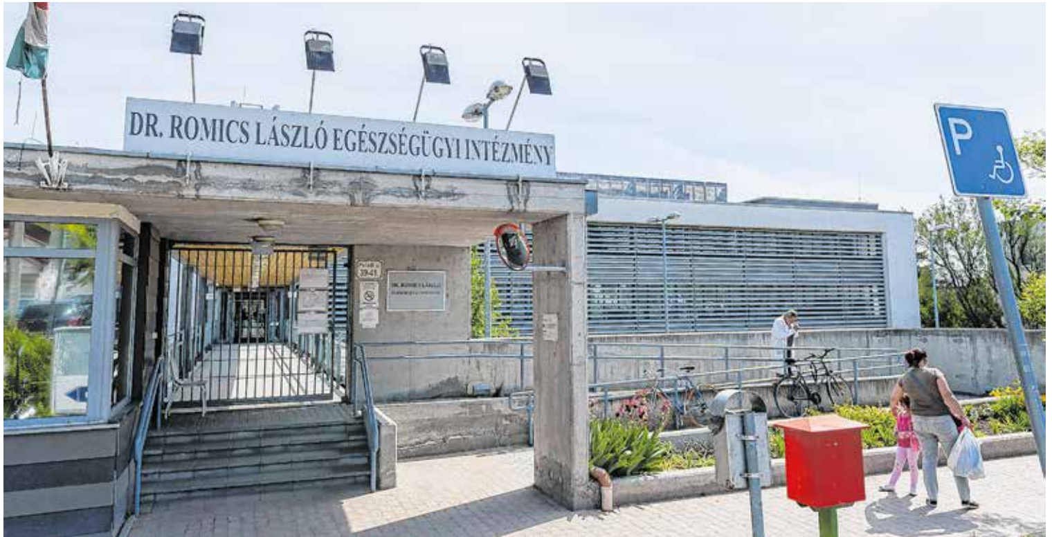
FOTÓ: KLING JÓZSEF