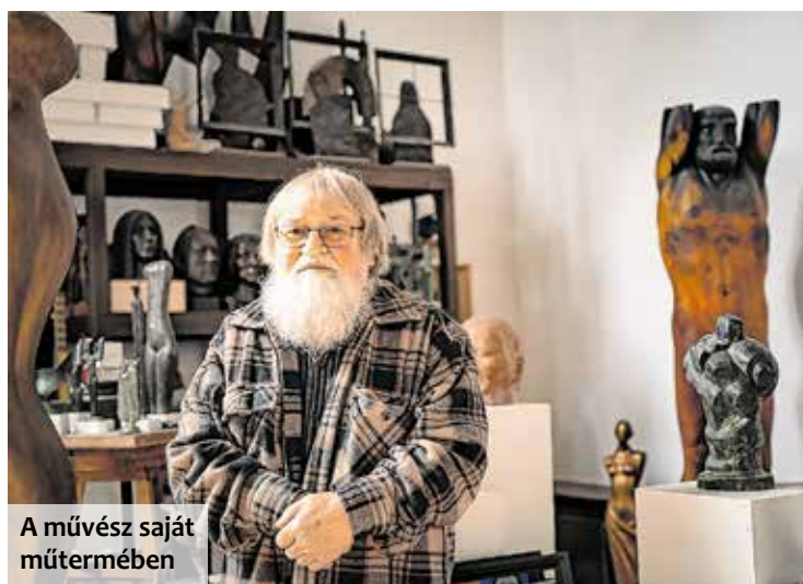
A művész saját műtermében

A díj átvételekor úgy fogalmazott: egész életében ösztönösen igyekezett hozzátenni valamit a nagy közösség értékrendjéhez.