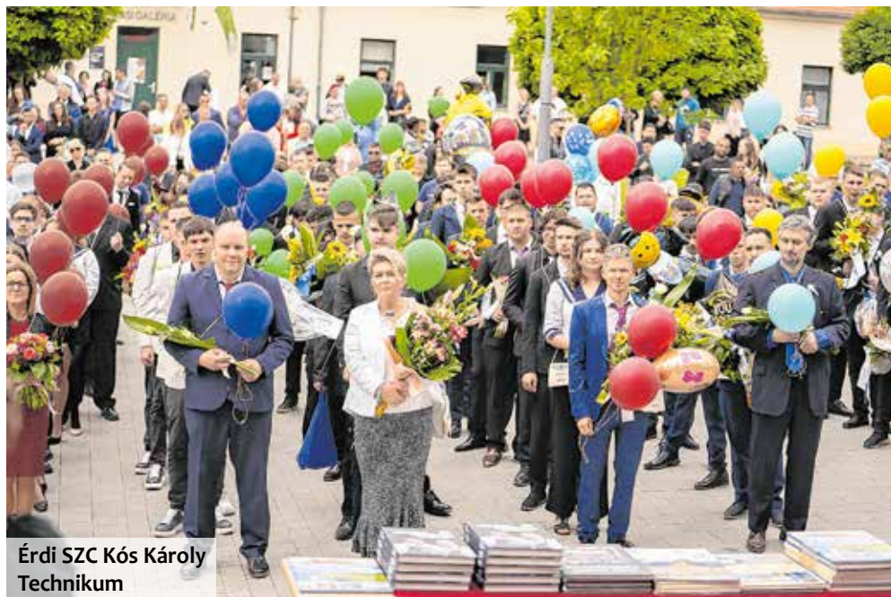
Érdi SZC Kós Károly Technikum