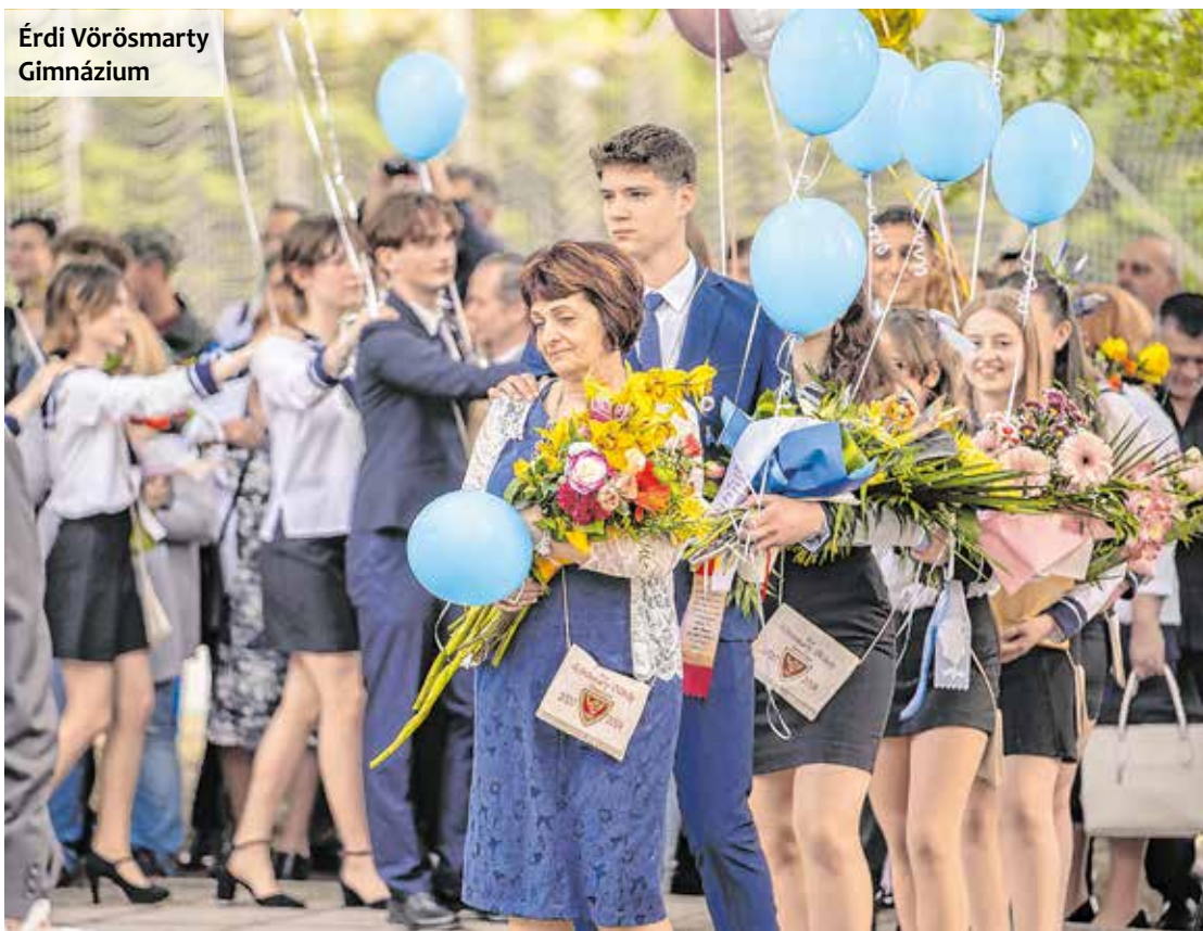
Érdi Vörösmarty Gimnázium

A VMG-ben tavaly 4,74 volt a középszintű, 4,8 pedig az emelt szintű érettségi átlag. Mivel változik az érettségi pontok beszámítása, idén jelentősen megnőtt azok száma, akik emelt szintű vizsgára mennek. A legnépszerűbb emelt szintű érettségi tantárgy a matematika és az angol.