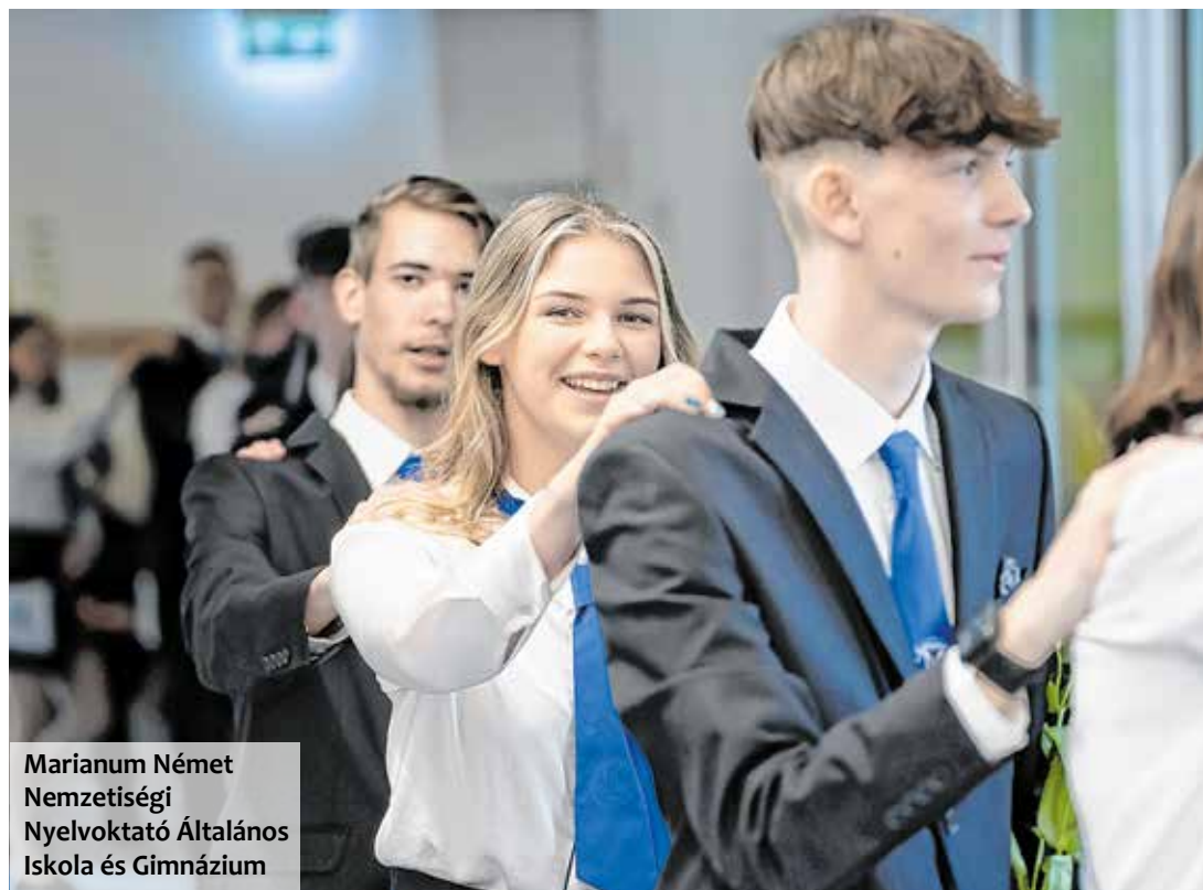
Marianum Német Nemzetiségi Nyelvoktató Általános Iskola és Gimnázium