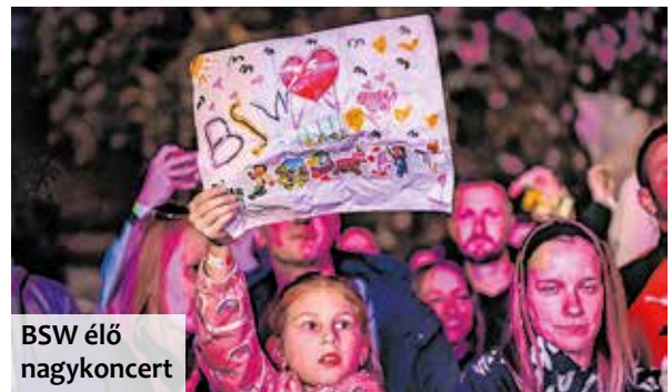
BSW élő nagykoncert