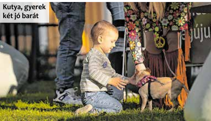
Kutya, gyerek két jó barát