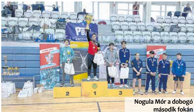
Nogula Mór a dobogó második fokán

A 115 indulós(!) serdülő fiú versenyen, a Danubius RSC vívója a hibátlan selejtezőcsoport után, az egyenes kieséses küzdelmekben is sorra nyerve asszót jutott döntőbe, ahol Honvédos ellenfele volt az egyetlen, akinek sikerült megállítania őt.