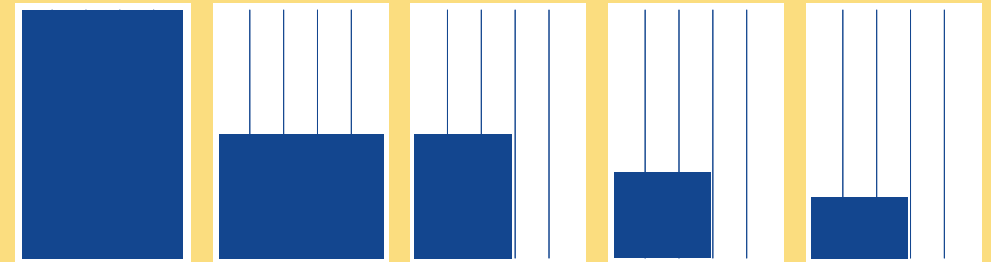
1/1 U-6 260 x 366 mm 545.340 Ft